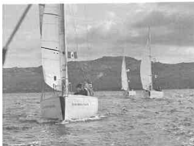
In flottiglia con i Levante