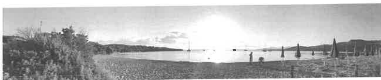
La spiaggia Le Saline

Centro Nautico di Levante s.r.l. Sportiva Dilettantistica – Corso Francia 75 – 10138 Torino Cod. Fisc./ N.Reg.Imp.To 97508890015 – REA 1050422– Part. IVA 07747580012 – Cap.Soc. € 10.106,00 int.vers. Tel. 0114330576 – Fax 01119837583 - E-mail: info@velalevante.it - Sito web: www.velalevante.it