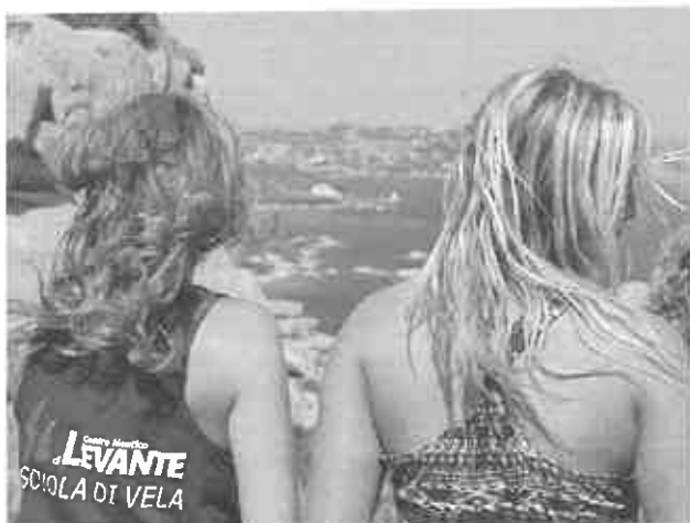
Affacciarsi al Golfo da Capo d'Orso

Imparare ad andare in barca a vela accresce l'autostima di ciascun ragazzo, gli fa conoscere i propri limiti e insegna il rispetto per gli altri e per la natura.